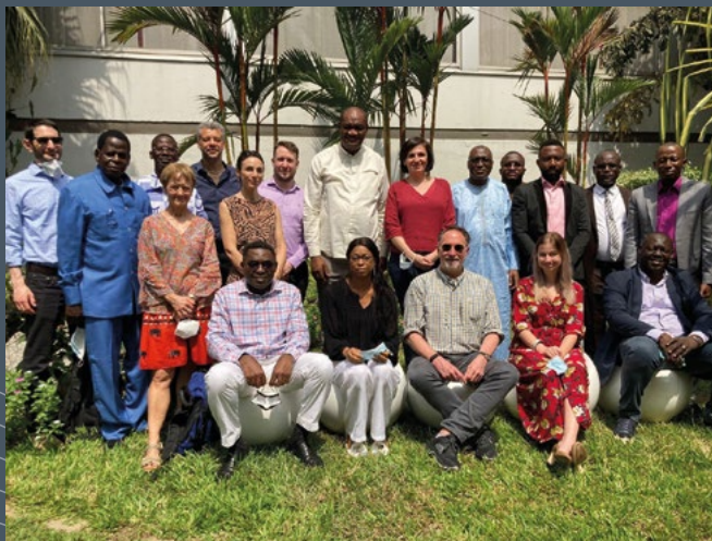
L'équipe ACE tient une réunion de développement du programme à Abidjan (février 2022)